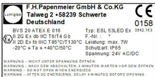
Abbildung 1 Typenschild